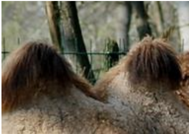
KÉT PÚPÚ TEVE

5. Négy, a Miskolci Állatkertben is élő állat egy-egy részletét látod. Kettő vízközelben él, a másik kettő viszont távoli sivatagokban, és hosszú ideig kibírják víz nélkül. Felismered őket egy-egy testrészük alapján? (4 pont)